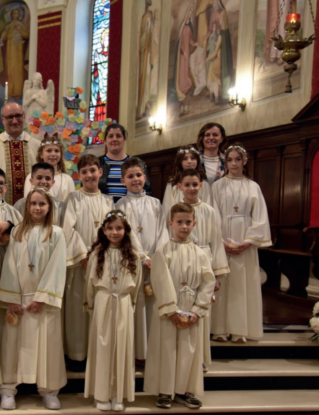
Gruppo della Prima Comunione del 2026 della parrocchia di Salgareda